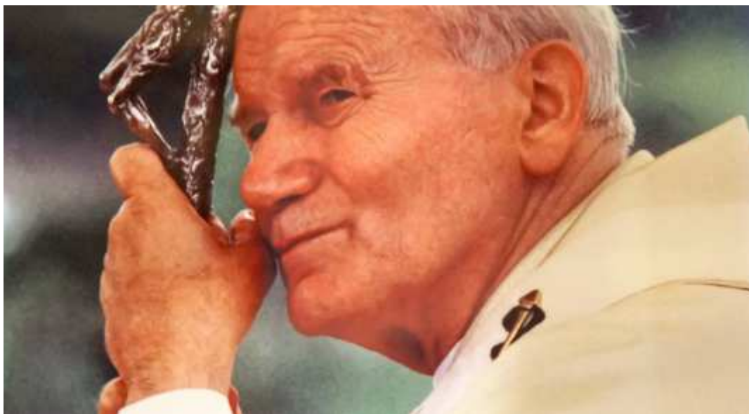
Jan Paweł II

39 lat temu, 16 października 1978 roku, o godzinie 18.18 znad Kaplicy Sykstyńskiej na placu świętego Piotra w Rzymie uniósł się biały dym. Był to znak, że kardynałowie zgromadzeni na konklawe wybrali następcę świętego Piotra. Okazał się nim kardynał Karol Wojtyła z Polski.